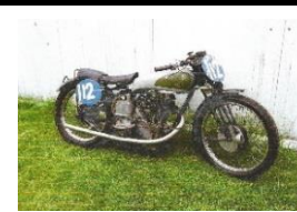
New Imperial 350cc GP 1934 - UK - N° 350