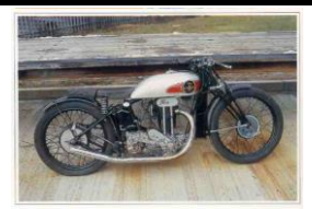
Excelcior Works Racer 500cc 1930 - UK - N°