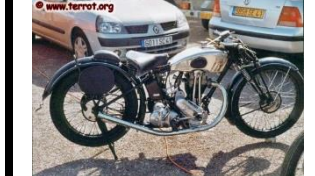
Terrot RCP 500cc 1931 FR - N° 338