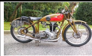
Motosacoche 415 - D50 500cc - 1930 - FR - N° 322