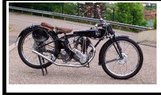
TERROT 175cc LCP 1934 FR - N° 347