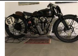
VELOCETTE KTT MK III 350cc 1932 - DE - N°364