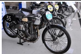
TERROT NOUGIER RCP 500 1937 - FR - N° 381