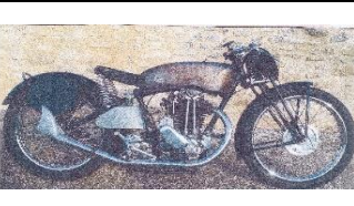
TERROT RCP 500cc Usine 1937 - FR - N° 325