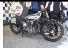
Norton Inter 500 1933 FR - N° 329