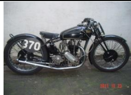
RUDGE 500 TT Replica 1932 - DE - N° 359