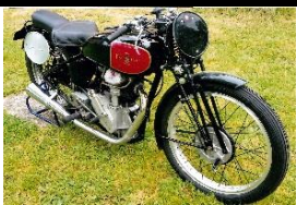
Excelsior J12 350cc 1939 FR - N°334