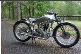
MGC N3BR 250cc 1932 FR - N°