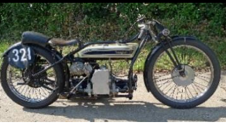
Douglas SW5 600cc 1928 UK - N° 351