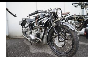
BMW R63 Course 1928 BE - N° 376