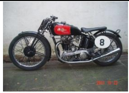
Excelcior Manxman 350cc 1936 - DE - N° 358