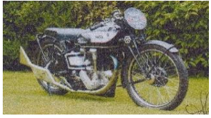
NORTON Type 30 Inter 490cc 1932 ( UK ) Brooklands Team N° 312