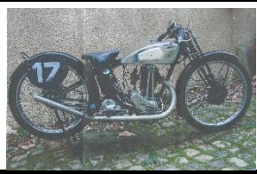
TERROT LCP 175cc Course FR - N° 331