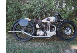
TERROT HCP2 350 1933 FR - N° 348