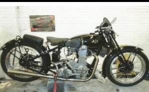
AJS 500cc Camshaft Trophy 1933 - UK - N° 306