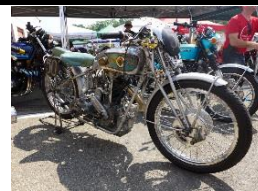
New-Map D50 500cc 1935 FR - N° 323