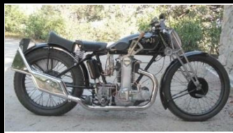
AJS R7 350cc 1930 FR - N° 317