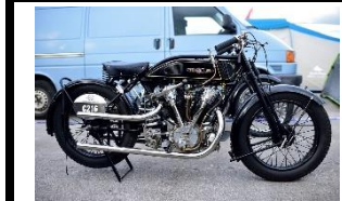
Koehler Escoffier K100 1927 - FR - N° 328