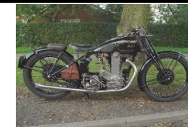
AJS R10 500cc 1935 UK - N° 308