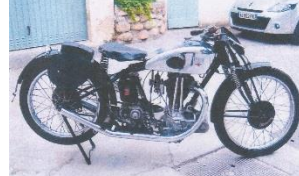
TERROT HCP 350cc 1931 FR - N° 341