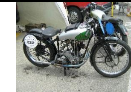
New Imperial GP 350cc 1934 - UK - N° 353