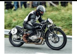
BMW WR500 1928 DE - N°