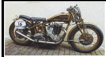
Motosacoche C50 500cc - 1929 - N°361