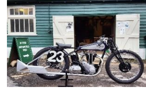
Triumph Special Brooklands T80 350cc - Brooklands Team UK - N° 371