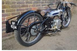
DOUGLAS SW 500cc 1928 UK -Brooklands Team N° 314