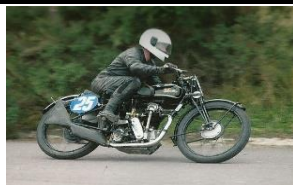
Velocette KTT MK1 350cc 1929 - UK - N° 352