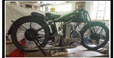
AJS R7 350cc 1929 Aut - N° 309