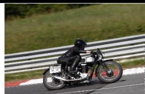
NORTON ES2 500cc 1935 FR - N° 330