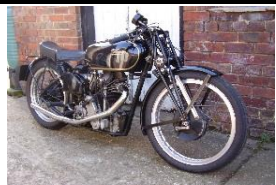
VELOCETTE KTT MKVI 1936 UK - N° 354