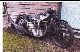
NORTON INTER 500cc 1934 UK - N° 305