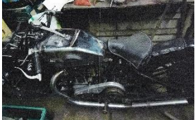
Magnat Debon BCP 350cc 1929 - FR - N°