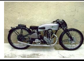
Magnat Debon 175cc LMCP 1934 - FR - N° 335