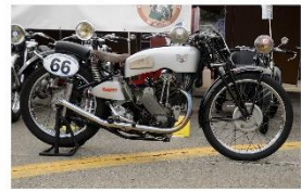
TERROT OCP 250cc 1935 FR - N° 319