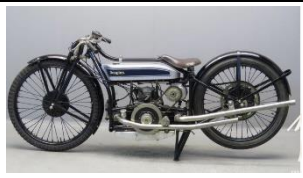
Douglas SW5 498cc 1928 DE - N° 356