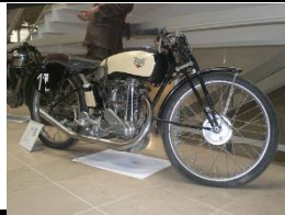
Terrot 175 LCP N° 186 128 1934 - FR - N°383