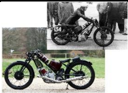
SCOTT Sprint Special 620cc 1920 - UK - N° 302