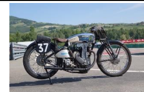
MAGNAT DEBON NOUGIER 1937 - FR - N°