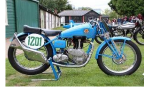
OK Supreme 350CC jap 1938 UK - Brooklands Team N° 372