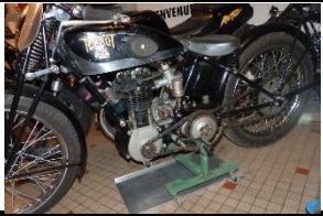
TERROT 175cc LR 1939 FR - N° 339