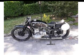
BMW R51RS 1939 BE - N°367