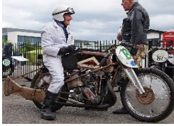
COTTON JAP 498cc SPECIAL UK - Brooklands Team N° 370