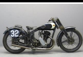
DURANDAL PYTHON 350cc 1933 - FR - N° 315