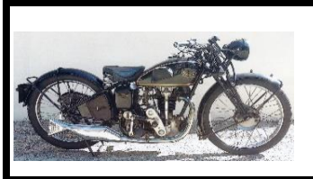
Velocette KSS 1933 FR - N° 333