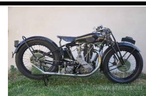
STYL'SON RK 500cc 1929 FR - N° 345