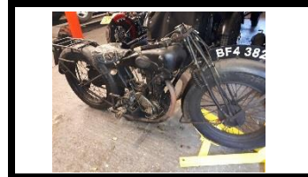
TERROT HSSO 1929 UK - N°