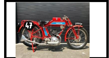
Monet-Goyon Brooklands 1929 - BE - N° 377