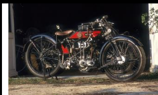
GNOME RHONE D2 500cc 1928 FR - n° 321