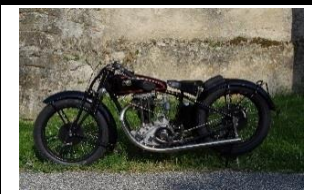
GILLET BOL D'OR 500cc 1930 - FR - N° 327