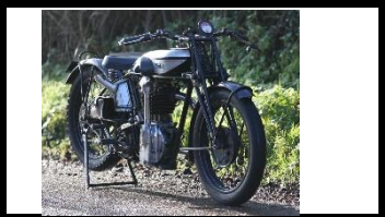
Norton CS1 500cc 1928 UK - N°366