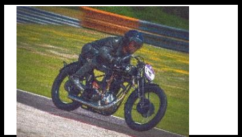
FN M67 1930 FR - N° 324