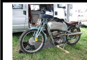
DKW SS 250 GP 1936 UK - N° 355