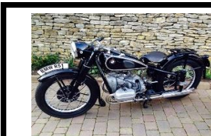
BMW R51 1938 ( JAP ) N°