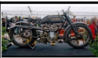
KOEHLER ESCOPIER 500cc 1927 - FR - N° 340