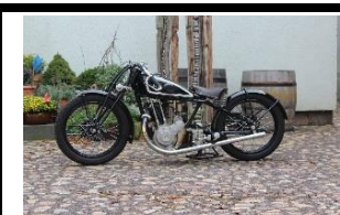
D-RAD Type R10 500cc DE - N° 360