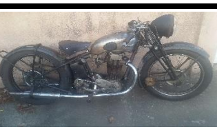
Koehler Escoffier PLS5 500cc 1937 - FR - N° 318