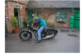
RUDGE SPECIAL 500cc 1928 - UK - N° 380