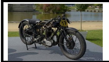
Sarolea 23RC 1928 BE - N° 379