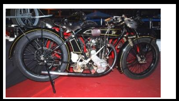
TERROT GSS 350cc 1924 FR - N° 332