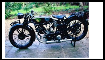
PANTHER TT Replica 1929 UK - N° 301