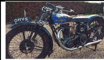
NEW MAP OHV5 500cc - 1934 - N° 336