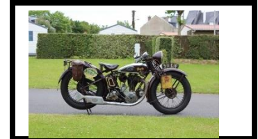
TERROT HSSR 350cc 1930 FR - N° 344