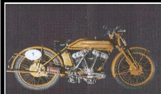
Motosacoche Super-Sport TT-700cc - 1926 - CH - N° 300