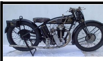
VELOCETTE Modèle K 350cc 1926 - UK - N°363