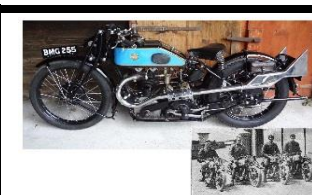
TRIUMPH TT 500cc 1928 UK - N° 304