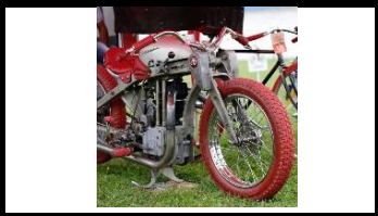
OPEL 500 1928 DE - N°362