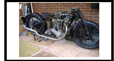
ARIEL Type A 550 1928 UK - N° 310