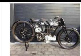
NORTON M25 500cc 1927 UK - N° 357