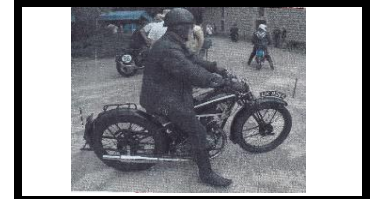
AKD 300 1930 Brooklands Team - N°375