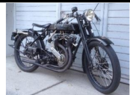
Motosacoche type 804 1000cc - 1924 - N° 365