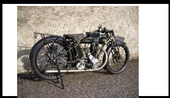
TERROT HSS 350cc 1926 FR - N° 369