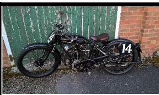
AJS Big Port 350cc 1926 UK - N° 307