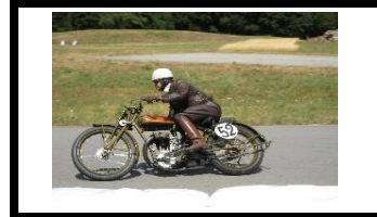
Motosacoche type 303 1927 - CH - N° 320