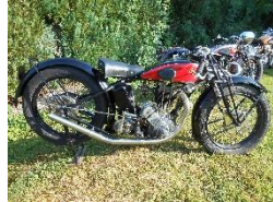
TERROT 500cc NSSO JAP 1930 - FR - N° 337