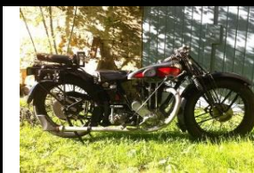
TERROT 500cc NSSO2 1929 - FR - N° 382