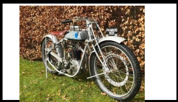
FN M60 SPORT 1926 BE - N° 378