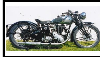
Triumph T90 500cc 1937 FR - N° 326