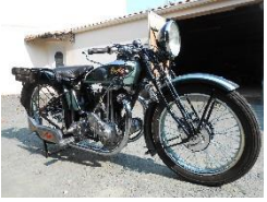
TERROT HSSE 350cc 1930 FR - N° 346