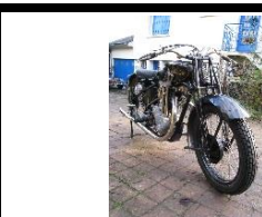
SAROLEA 24U 500cc 1929 FR - N° 349