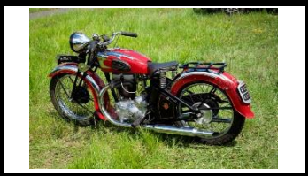
Motobécane M5CGS 500cc 1938 - FR - N° 342