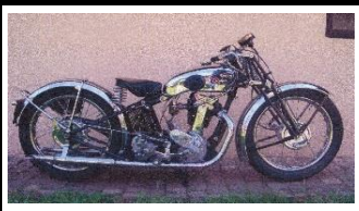
Koehler-Escoffier KLS 4C 350cc 1936 - FR - N° 311