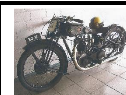
SAROLEA 23U 500cc 1928 DE - N°