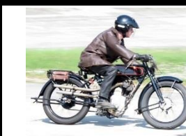
Koehler-Escoffier Mandoline 500cc - 1928 - N° 343