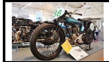
Rex Acme Blackburne 1926 Brooklands Team - N°374