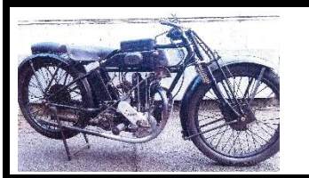
TERROT 350 JAP NSS 1926 CH - N° 303