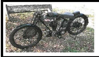
BSA L27SS 350cc 1927 FR - N° 316