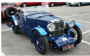
MG J3 MIDGET SPORTS 1933 - AUST - N° 092