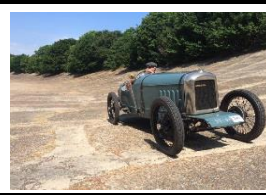
Amilcar Type G Brooklands 1926 - UK - N° 028