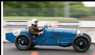
BUGATTI T37A GP R 1926 - FR - N° 195