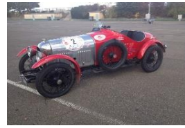
AMILCAR CGS compresseur CH - N° 165