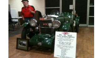
MG J3 750cc 1932 AUST - N° 188