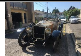
JOUFFRET SIDEA 4C5 1923 FR - N°