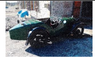
Austin Seven Ulster Sports 1931 - FR - N° 157