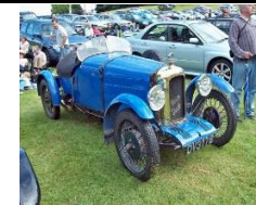
VERNON DERBY 1929 UK - N°