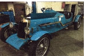
LEA FRANCIS HYPER S 1930 - CH - N° 183