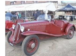
Fiat 508S Spyder 1934 FR - N° 150