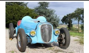
SIMCA MOSCADELLI Course 1934 - FR - N° 172