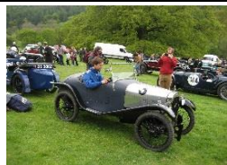
Austin Seven GE Cup Model 1928 - UK - N° 046