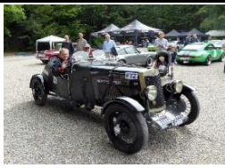
LEA FRANCIS Hyper S 1929 - DK - N° 090