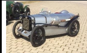
Austin Seven Brooklands 1927 - DE - N°002