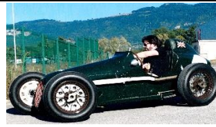
Austin 7 Single Seater 1936 - FR - N° 142