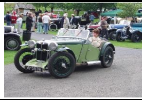
MG Type P 1934 UK - N° 104