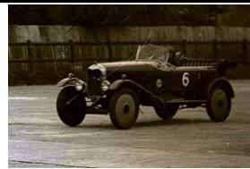
Palladium 1923 1500cc UK - N°