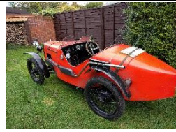
Austin Seven Ulster Rep UK - N° 097