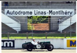
Austin Seven Ulster TT 1930 NL - N° 081