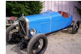
SALMSON VAL3/7 1926 UK - N° 64