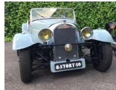
MORGAN 4-4 FLAT RAD 1937 - FR - 239