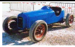
Amilcar Monoplace 1938 - FR - N° 187