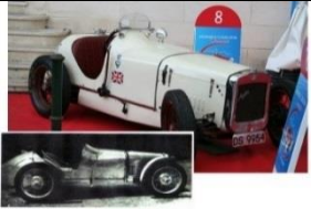
Austin Seven GP 1929 FR - N° 007