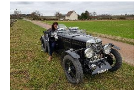
MG Type NA 1934 FR - N° 171