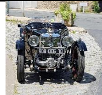
MG J2 Sport 847cc 1933 FR - N° 151