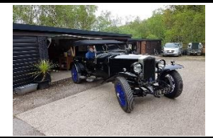
INVICTA 3 L - Cadogan 1928 - FR - N° 196