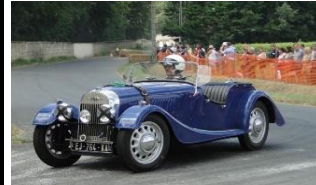
MORGAN FLAT RAD 1940 FR - N° 168