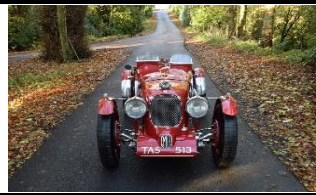
MG L1 Special 1933 DE - N° 242