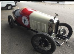
Amilcar CGSs 1928 CH - N°