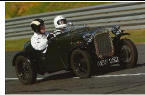
Austin Seven Ulster Sports 1931 - UK - N° 087