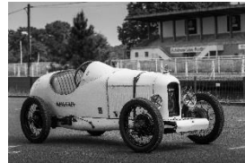
Amilcar CGSs 1927 DE - N° 031