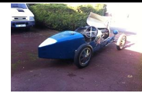
BUGATTI 35 1925 FR - N° 243