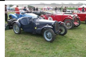
Austin Seven Dick Morris 1930 - BE - N° 156