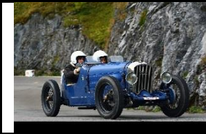
RALLY-SALMSON NCP 1500cc - 1930 - DE - N° 022