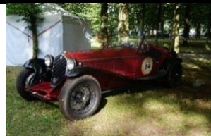
Alfa-Romeo 8C Touring Spider 2300cc - 1934 - N°