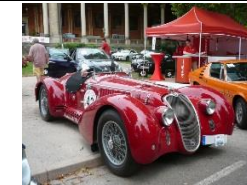
ALFA ROMEO 6C 2500 SS SPIDER 1939 - DE - N°210