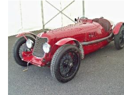
MASERATI 26M 1931 UK - N°