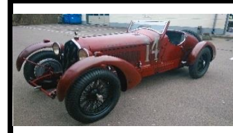
ALFA ROMEO 6C - 1933 1900 Corsa Spider - N°226