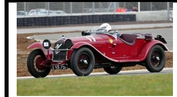
ALFA ROMEO 6C ZAGATO 1750cc 1930 -UK - N° 074