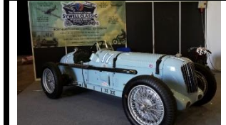
MG K3 K3009 Parnell 1933 CH - N° 023