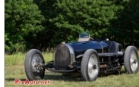
BUGATTI T59 GP 1934 - N°