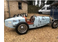
Bugatti Type 59 GP 1934 UK - N°059