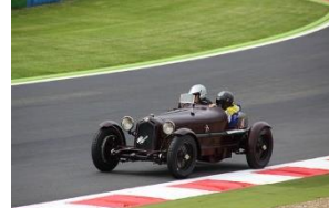
Alfa Romeo-8C_Monza 1932 FR - N°