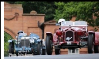
Alfa-Romeo 6C-1750GS - 1930 UK - N° 062