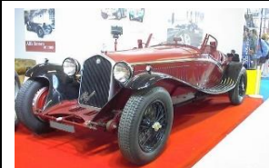
Alfa Romeo 6C 1750 Touring Touring 1929 - FR - N°