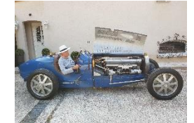
Bugatti T54 GP 1931 FR - N°