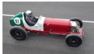
MASERATI 8CM - Monoposto 3000cc - 1933 - CH - N° 039