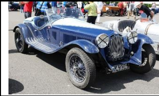
ALFA ROMEO 6C ZAGATO 1932 - NL - N°