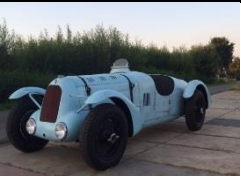
TALBOT-LAGO T150C Course 1938 - DE - N°