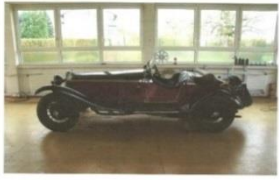
Alfa-Romeo 6C-1750GS-Zagato 1933 - DE - N° 129