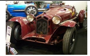
ALFA ROMEO 8C MONZA 2,3L 1933 - CH - N°206