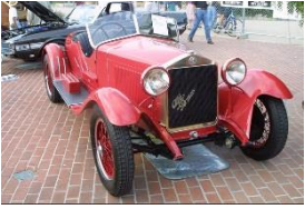
Alfa Romeo-6C-1500_Spider 1928 - FR - N° 118