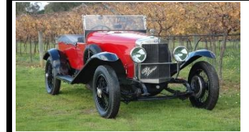
ALFA ROMEO RLS 1923 NL - N°