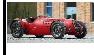
Alfa Romeo 8C COURSE 1938 FR - N° 108