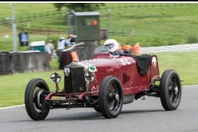
ALFA ROMEO RL Targa Florio 1924 - UK - N° 223