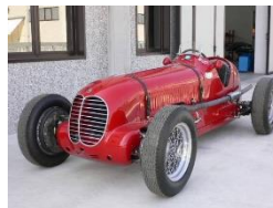
MASERATI 6CM 1936 CH - N°207