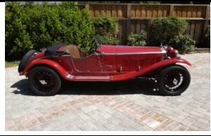
ALFA ROMEO ZAGATO 6C 1750cc - 1930 - UK - N°001