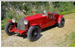
ALFA ROMEO 6C 1500MMS 1928 - UK - N°216