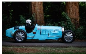
BUGATTI Type 54 GP 1933 UK - N°