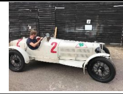
Alfa Romeo 8C Monza 1932 UK - N°