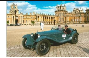
Alfa Romeo 8C Touring Spider 1933 - UK - N° 071