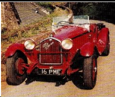
ALFA ROMEO ZAGATO 6C 1750cc - 1931 - UK - N° 117