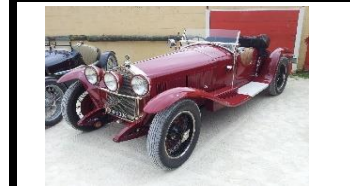
ALFA ROMEO 6C CARROZZERIA SPORT MILANO 1929 - CH - N° 008