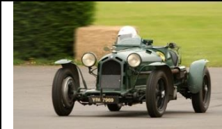
Alfa Romeo 8C Monza 1932 - UK - N°094