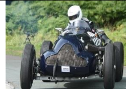
BROOKE E.R.A Special 1936 DE - N° 011