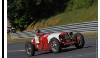
MASERATI 26M 1928 - N°200