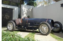
Bugatti T59/50S GP R 1935 NL - N° 212