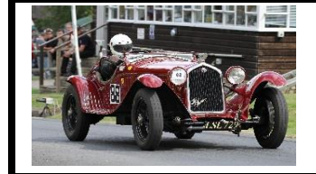
ALFA ROMEO 6C Corsica 2300 1934 - UK - N°