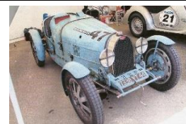
Bugatti T35C 1927 FR - N°