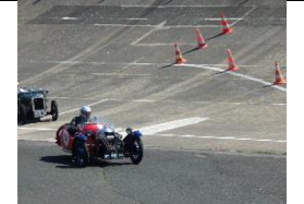
MORGAN SPORT FAMILY 1934 - FR - N° 143