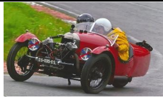
Darmont Special 1928 FR - N° 162