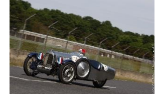
Sandford type S 1932 FR - N° 137