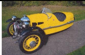
MORGAN Super Sports 1934 NL - N° 186