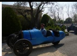
DARMONT Special Usine 1927 - FR - N°198