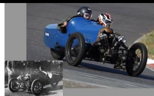
DARMONT Special Supercharger 1927 - FR - N° 070