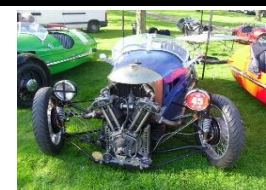
MORGAN Super Sport 1934 - UK - N° 073