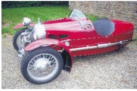
MORGAN MX4 SS 1934 - FR - N° 138