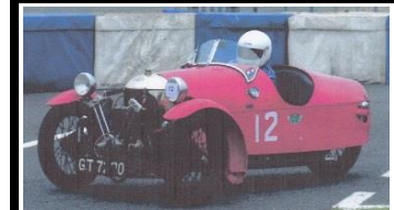
MORGAN SS 1096cc 1932 - UK - N°