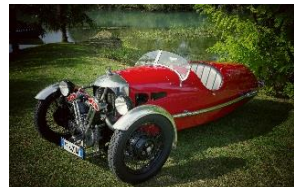
MORGAN MX4 SS 1935 - IT - N° 010