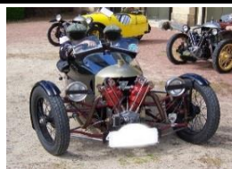
MORGAN Super Aero 1926 FR - N° 176