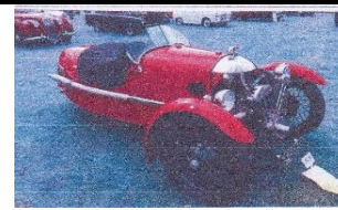
MORGAN SS 1932 UK - N° 084