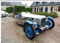
SANDFORD GS 1100cc 1929 FR - N°