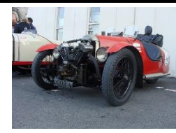
DARMONT SPECIAL Course 1930 - FR - N° 173