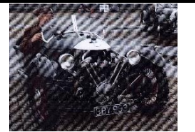
MORGAN Sports 1933 BE - N° 192