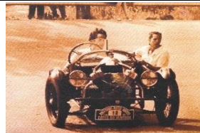
DARMONT Special Usine 1926 - FR - N° 146