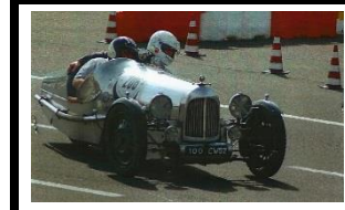
SANDFORD GS 1929 FR - N° 125