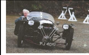
MORGAN SS 1932 UK - N°126