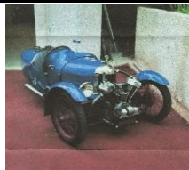
DARMONT Special 1926 FR - N° 050