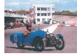
Darmont Special 1927 - FR - N° 121