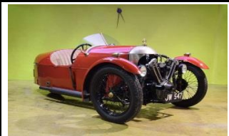
MORGAN Super Sport Aéro 1928 -UK - N° 029