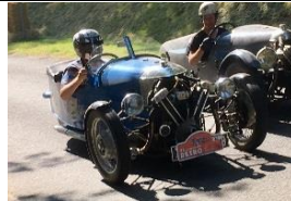
MORGAN Sports Family 1933 UK - N° 103