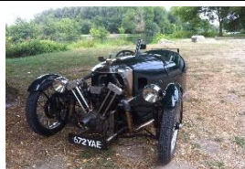
MORGAN Super Sport 1932 - UK - N°100