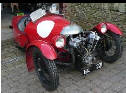
MORGAN Super Aero 1928 UK - N°