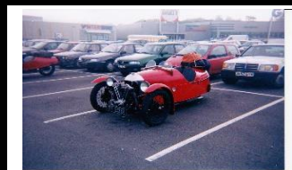
MORGAN Super Sports Aero 1929 - UK - N°