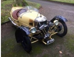
MORGAN Super Aéro 1928 - CH - N° 012