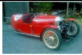
MORGAN Super Aéro 1200cc UK - N° 052