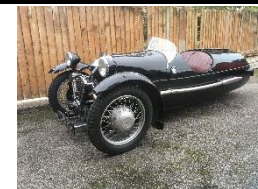
MORGAN SUPER SPORT MX4 1936 - UK - N° 083