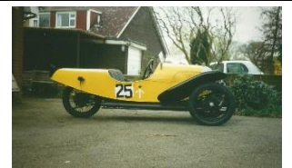
Morgan Aéro 1927 1927 UK - N° 235