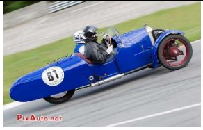
DARMONT Special 1927 FR - N° 149