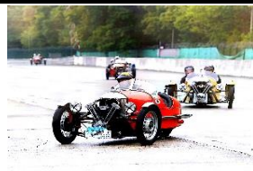
MORGAN Super Sport 1933 - FR - N° 153