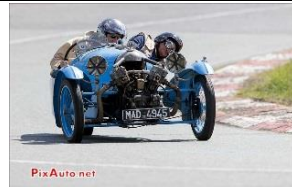
DARMONT Special 1927 FR - N° 231