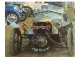
MORGAN 210 MILE AERO 1922 - UK - N° 102