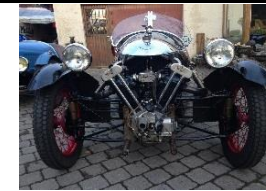
MORGAN SS BeetleBack 1932 - FR - N° 115