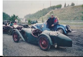
Riley 9 Brooklands 1928 DE - N°004