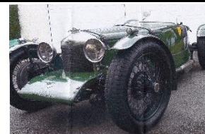
RILEY BROOKLANDS 1930 - FR - N°