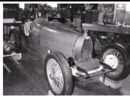
Bugatti Type 37 Usine 1927 - FR - N° 135