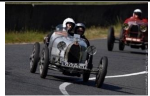
Bugatti Type 35 Grand Prix 1991cc - 1924 - FR - N° 124