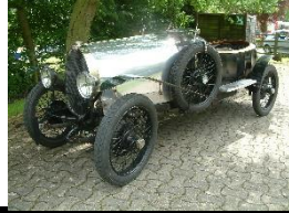
BUGATTI T22 1925 FR - N° 065