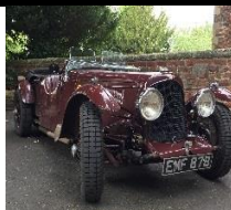
Aston Martin 2L Speed Model 1936 - UK - N° 044