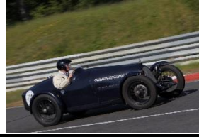
BNC 527 Montlhery 1929 DE - N°015