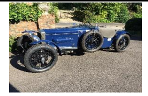
Frazer Nash Sports 1934 UK - N° 219