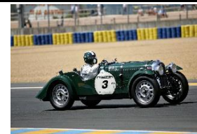
Morgan 4-4 Sports 1937 - UK - N° 078