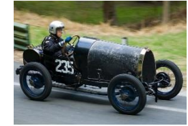
BUGATTI Brescia T13 1924 UK - N°