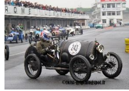
Bugatti Brescia T13 1921 FR - N° 158