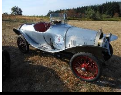
Bugatti Brescia T23 1924 - FR - N° 193