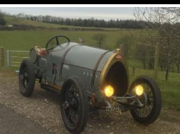
Bugatti Brescia type 22 1921 UK - N° 067