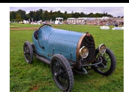
BUGATTI Type 13 1925 FR - N° 131