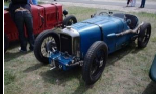
AMILCAR C6 COURSE 1100cc - 1926 - N° 205