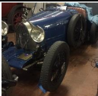
Bugatti Type 37 GP 1930 IT - N° 037