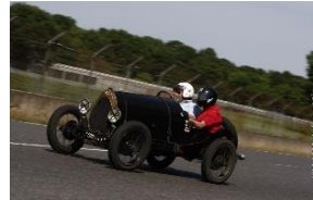
Bugatti type 13 1922 FR - N° 139