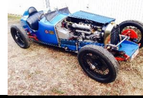
Lombard AL3 GP 1927 BE - N° 213