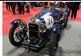
Amilcar C6 Course 1927 FR - N° 119