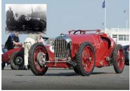
Amilcar-C6-RACING-1927 Chine - N° 041