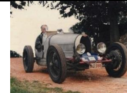
BUGATTI T35 COURSE 2000cc - 1925 - N° 035