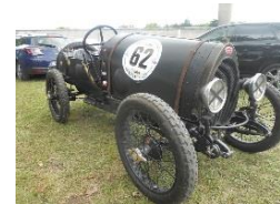
Bugatti T13 Course 1921 FR - N° 170