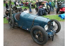
Amilcar C6-CO 1926 UK - N° 055