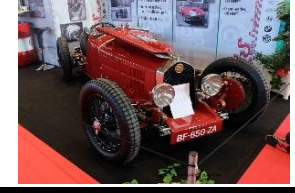
Lombard AL3 1927 FR - N° 122