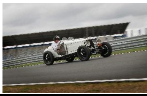
RILEY 12-4 TT Sprite Race 1935 - NL - N° 225