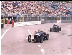
AMILCAR C6 RACING 1100cc - 1927 - CH - N° 040