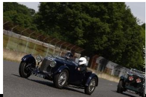
ASTON MARTIN Le Mans 1933 - UK - N° 003