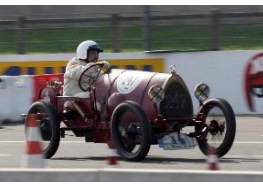
Bugatti T13 Brescia 1921 TCH - N°202