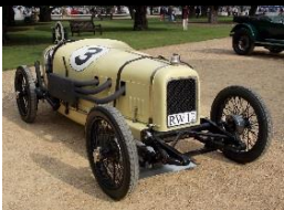
ALVIS 200 Miles Race 1924 - UK - N° 086