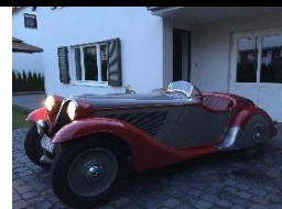
BMW 315/1 Sport 1934 DE - N° 185