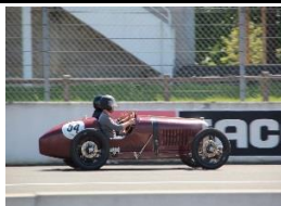
Amilcar C6 Racing 1928 1927 - DE - N° 025