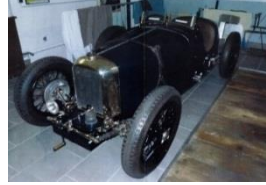
AMILCAR C6 RACING 1100cc - 1927 - DE - N° 051