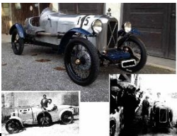
Salmson San Sebastian GP 1928 - CH - N°208