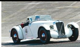
Georges Irat MDU Roadster 1937 - FR - N° 141