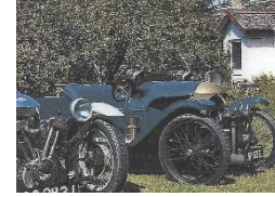
Morgan GP 978cc 1922 UK - N° 049