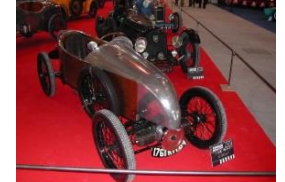
Sima-Violet 500cc 1925 - FR - N° 144