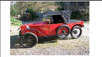
Alcyon RR 500cc 1924 FR - N° 166