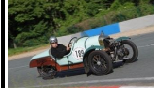
DARMONT STO -Sport 1922 - FR - N°