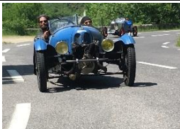
Darmont Etoile de France 1937 - FR - N° 114