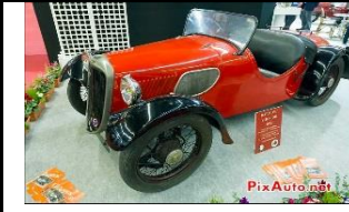
DARMONT Junior 1935 FR - N° 111