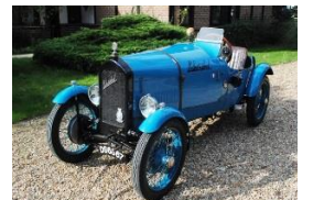
SENECHAL TS2 1924 UK - N° 027