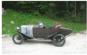
Amilcar CV Skiff 1922 - UK - N° 113