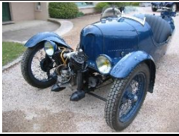
Darmont Etoile de France 1933 - FR - N° 179