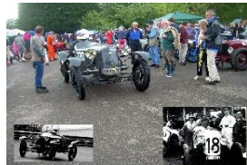
TATRA T11 Renn wagen 1925 - UK - N° 182