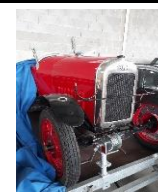
Benjamin type R FR - N° 238