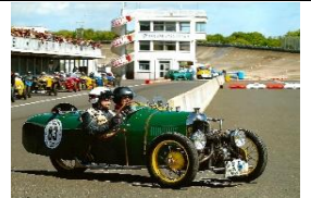
Darmont STR-SG 1923 FR - N°209