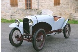
Amilcar CS 1923 FR - N°199