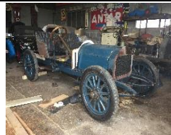
Darracq 1912 FR - N° 116