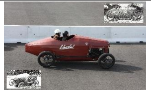
SENECHAL SS 1922 DE - N° 026