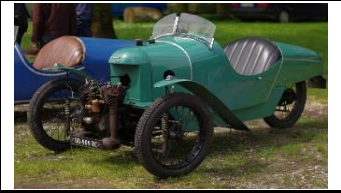
DARMONT STR SPORT 1923 FR - N° 160