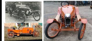
GN Cyclecar 1914 UK - N° 085