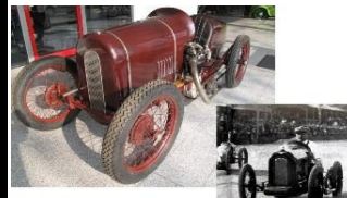
SCHASCHE Cyclecar Monopost 1928/29 - DE - N°060