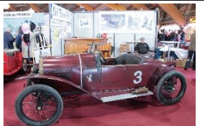
Hinstin Cyclecar 1920 BE - N° 110