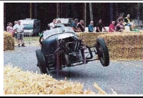
Darmont STR 1000cc 1927 FR - N° 221