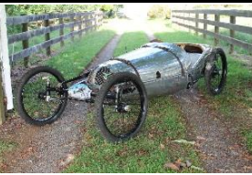
JAPPIC Racing 500cc 1925 NZ - N° 101