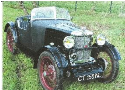
MG Type M 1931 FR - N° 240