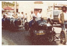
Morgan TW 1923 FR - N° 140