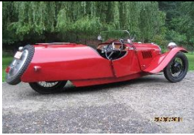
MORGAN F Barrel Bacq 1939 - BE - N° 233