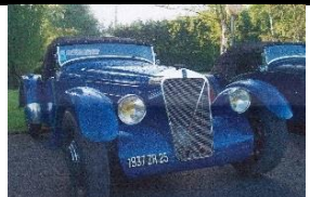
Georges Irat MDU Roadster 1937 - FR - N° 241