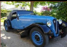
Georges Irat ODU Roadster 1938 - FR - N° 167