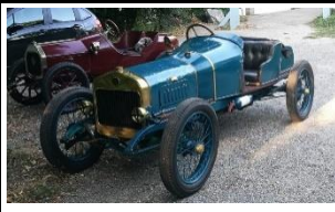
Delage Type R Sport 1910 FR - N° 088