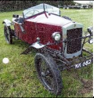
GN Boulogne Speed Trial 1922 - UK - N°