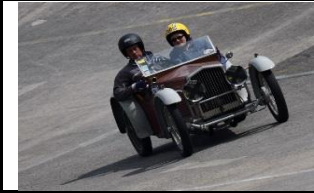
Bécognée type Original 1929 - FR - N° 217