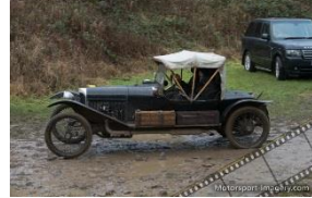
GN Sports Tourer 1500cc 1921 - UK - N° 056