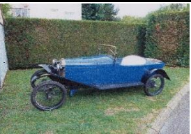
SALMSON AL 22 1922 FR - N° 147