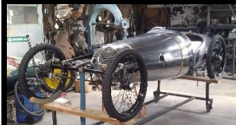
JAPPIC 350cc Racing Special UK - N° 227