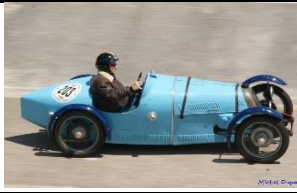
BNC 527 Monza Sport 1929 - FR - N° 112