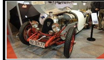
BNC 527 MONZA 1929 FR - N° 180