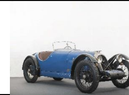
RALLY ROY 1100cc 1925 FR - N° 232