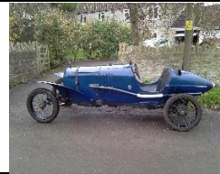
Salmson GS 1921 DE - N° 005