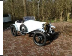
SALMSON VAL3 SPORT 1924 - NL - N° 061