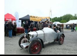
Amilcar CGSs Duval 1927 DE - N° 058