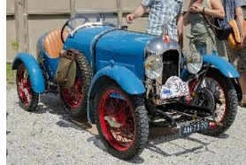
Amilcar CGSs Duval 1927 - NL - N° 017