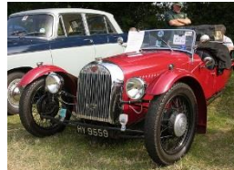
MORGAN Type F - SS 1939 FR - N° 197