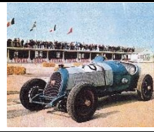
BNC 529 Course 1929 - BE - N° 038