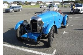
Amilcar CGSs Duval 1928 FR - N° 57