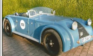
CHENARD & WALKER TANK Y8 - 1929 - DE - N° 130