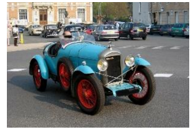
Amilcar Cgs3 1924 FR - N° 024