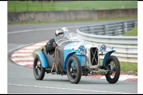
SALMSON GS8/GSS GP 1928 - NL - N° 020