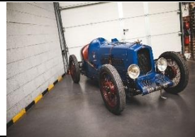
G.A.R BoL d'Or Supercharger 1927 - FR - N° 152