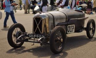
Salmson GS 8 1927 UK - N° 019