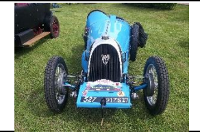
BNC 527 1100cc 1926 FR - N° 244