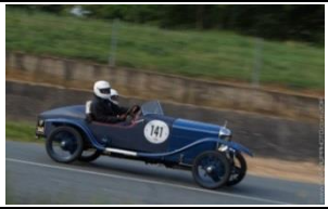
Salmson GSS Sports 1926 UK - N° 063