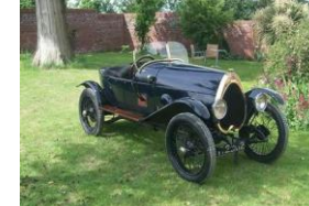
Bugatti Type 22 - 1922 UK - N°127