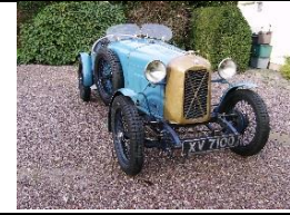
Salmson GS8 1928 FR - N° 134