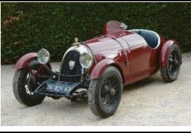
BNC 527 MONZA 1929 FR - N° 234