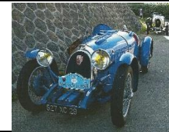
BNC 527 MONZA 1928 FR - N° 169