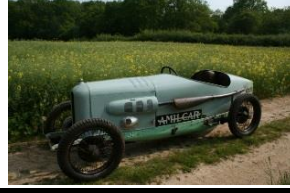
Amilcar CGSS 1928 UK - N° 095