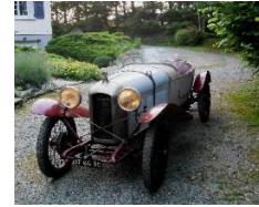
AMILCAR CGS3 1923 FR - N°