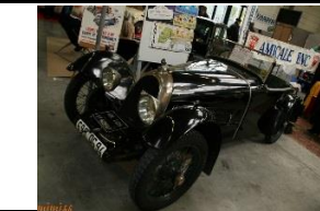
BNC St Hubert 1929 FR - N° 107