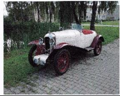
Amilcar CGS Duval 1925 DE - N° 009