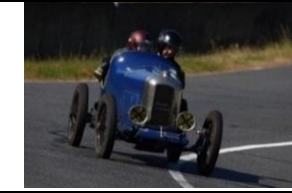
Amilcar CGSs 1927 IT - N° 220