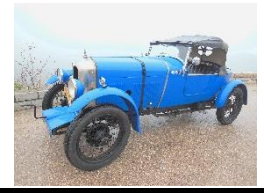
Amilcar CGS3 1924 FR - N° 154