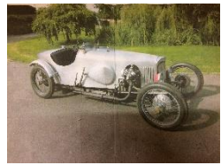
GN OHC 1500cc 1922 UK - N°201