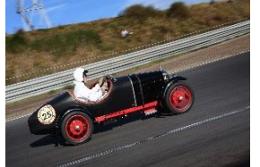
AMILCAR CGSs 1927 DE - N° 016