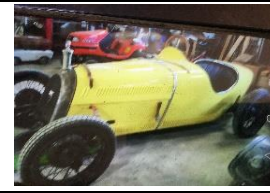
BNC 527 MONZA FR - N°194