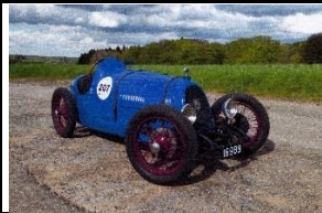
BNC 527 MONZA 1928 LU - N° 204