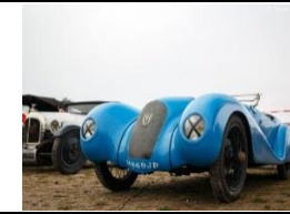
BNC 527 Sirejol 1934 FR - N° 136