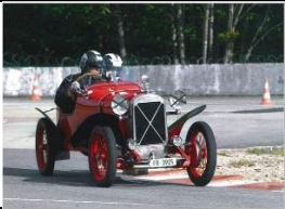
Salmson VAL3 GS 1927 CH - N°