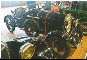
Amilcar CGS SPORT 1925 FR - N° 106